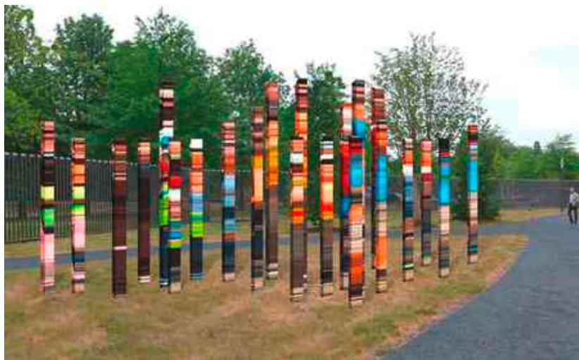
Entwurf "Zusammenhalt" des Berliner Künstlers Roland Fuhrmann für die Außenanlagen des Bundesinnenministeriums

Die Wettbewerbsarbeiten werden im Rahmen einer Ausstellung im Foyer des Bundesamtes für Bauwesen und Raumordnung, Straße des 17. Juni 112, 10623 Berlin, präsentiert. Eröffnet wird die Ausstellung am Dienstag, dem 28. Februar 2017, um 17 Uhr, und ist anschließend bis zum 15. März 2017, Montag bis Freitag von 9 bis 18 Uhr zu sehen.