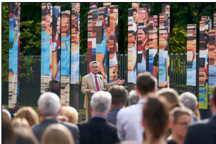
Bundesinnenminister de Maizière weiht das Kunstwerk "Zusammenhalt" ein